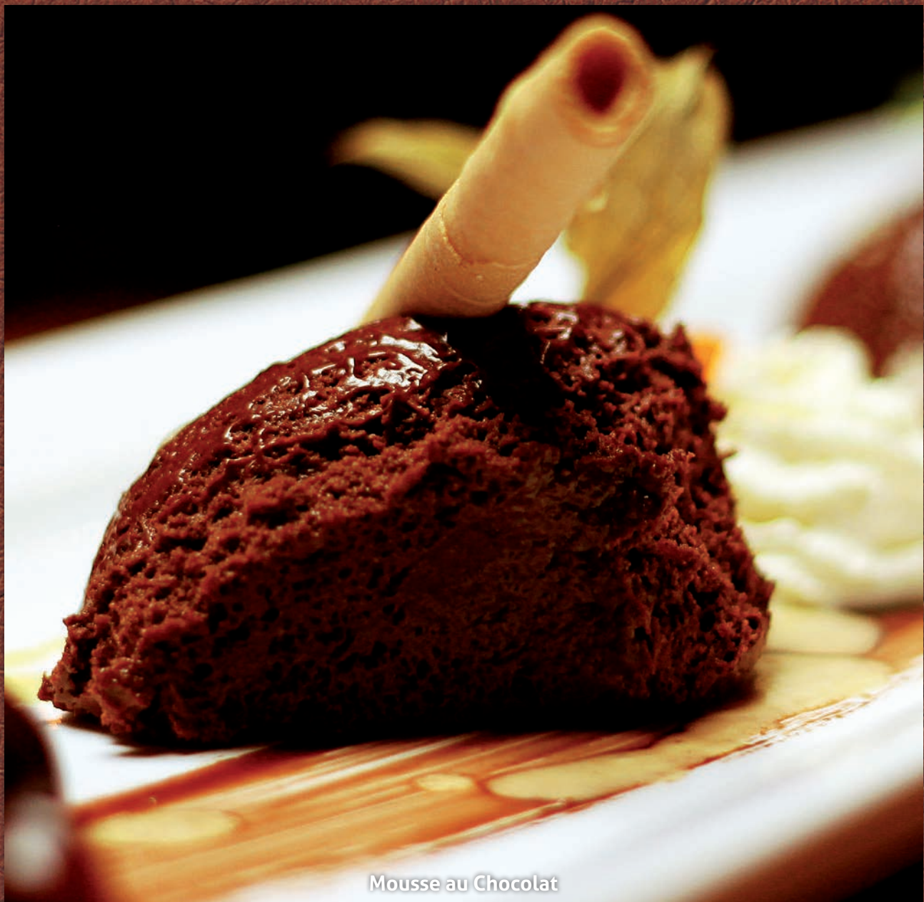
Mousse au Chocolat

Zusatzstoffe: 1 mit Farbstoff(en) 2 mit Konservierungsstoff(en) 3 mit Antioxidationsmittel 4 mit Geschmacksverstärker(n) 5 mit Schwefeldioxid 6 mit Schwärzungsmittel 7 mit Phosphat 8 mit Milcheiweiß 9 koffeinhaltig 10 Chininhaltig 11 mit Süßungsmittel(n) 12 enthält Phenylalaninquelle 14 mit Taurin