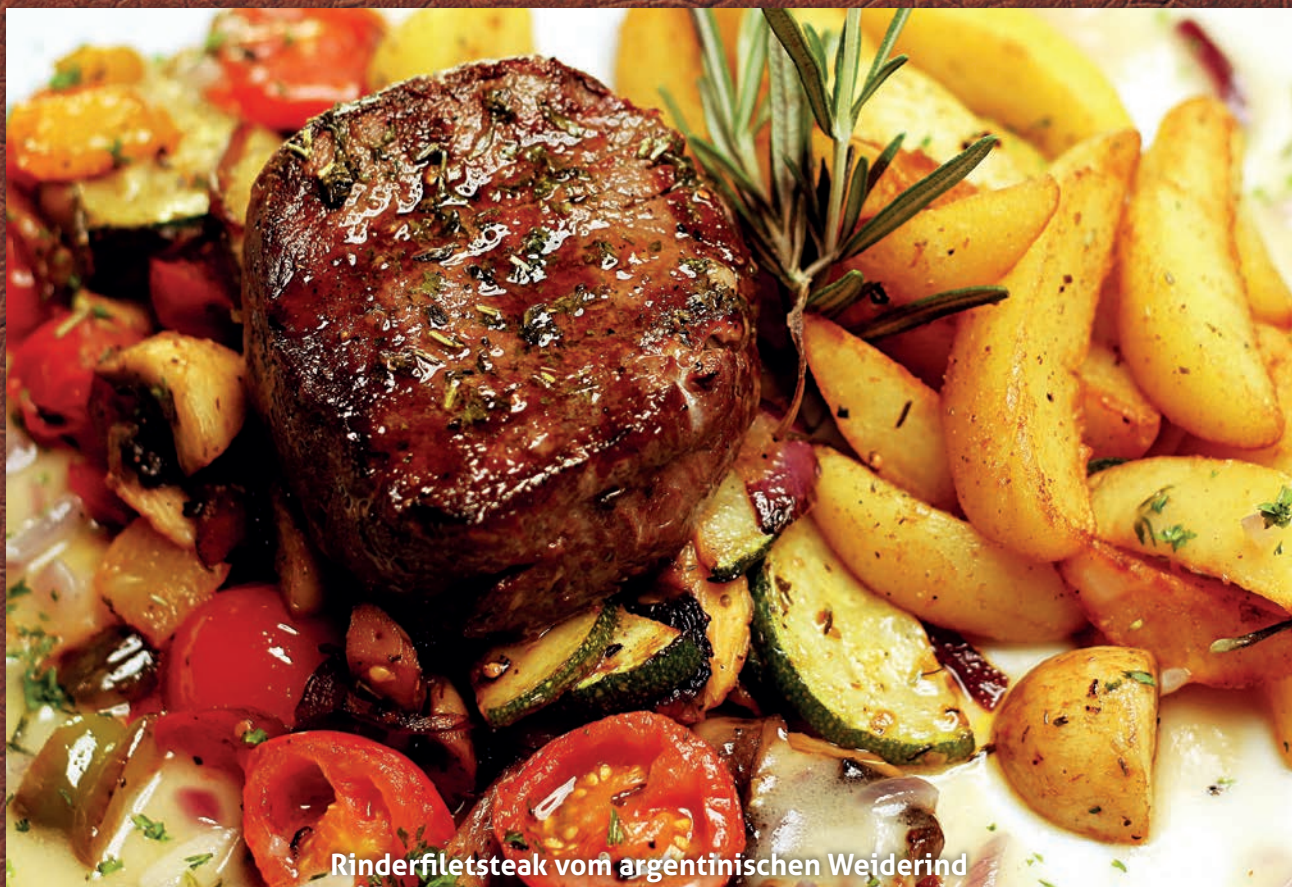
Rinderfiletsteak vom argentinischen Weiderind

Sauce Bernaise, Metaxasauce, Rosmarinsauce, Pfeffersauce, Gorgonzola Sauce