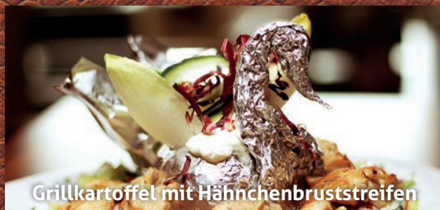
Grillkartoffel mit Hähnchenbruststreifen

Hähnchen- und Schweinefilet mit Zwiebeln, Champignons, Dönerfleisch, Rosmarinkartoffeln in Metaxasauce, Käse überbacken, dazu Salat 8 ..... 34,90€