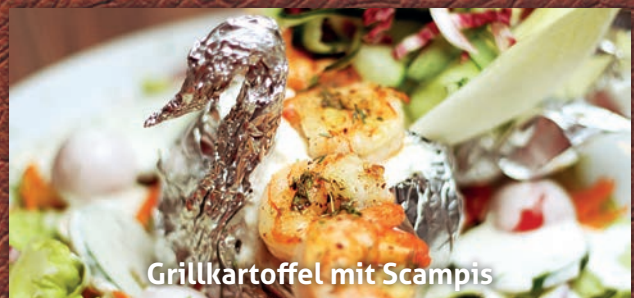
Grillkartoffel mit Scampis