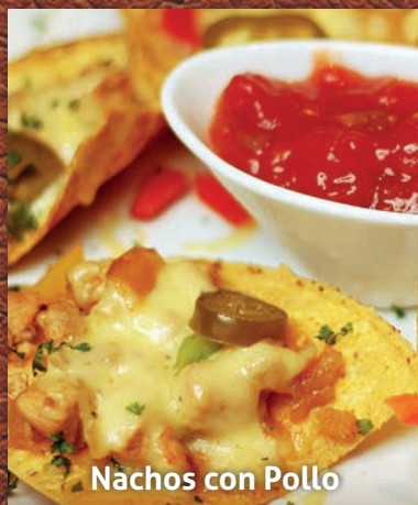
Nachos con Pollo